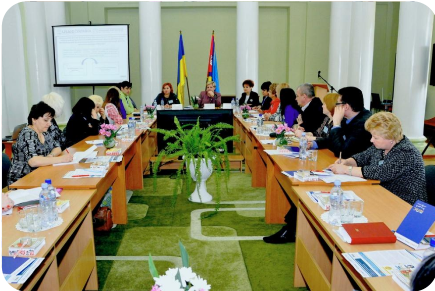
м. Первомайськ (березень 2017 року)

Асоціація міст України СПІЛЬНИМИ ЗУСИЛЛЯМИ