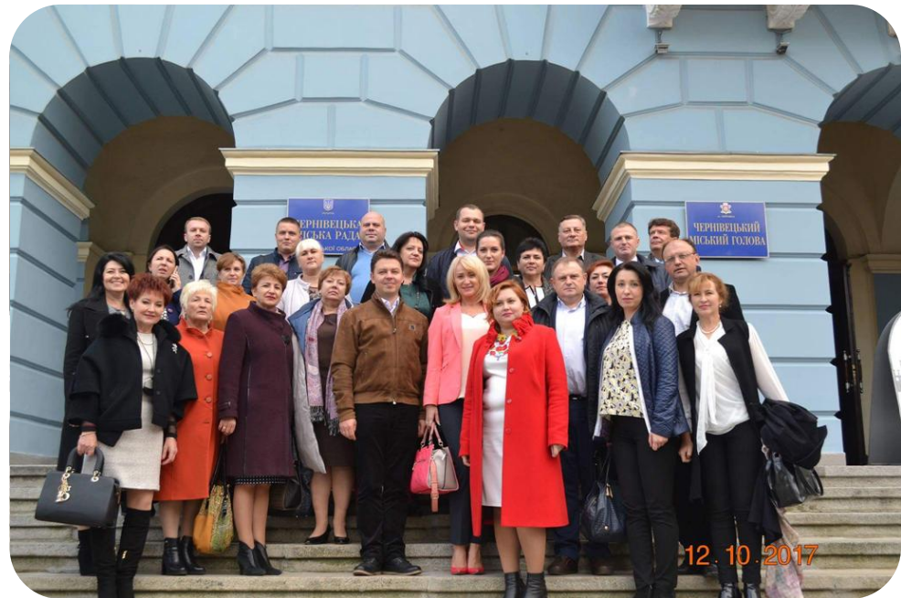
м. Чернівці (жовтень 2017 року)