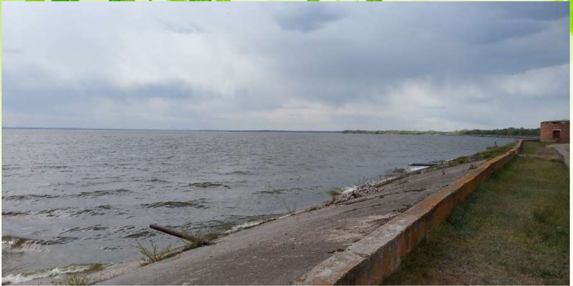
Місце водозабору- Каховське водосховище. Дамба № 4.