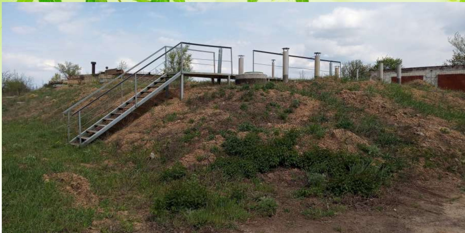
РЧВ об'ємом 1100м 3 . (Проект водогону від II підйому до с. Вищитарасівка).