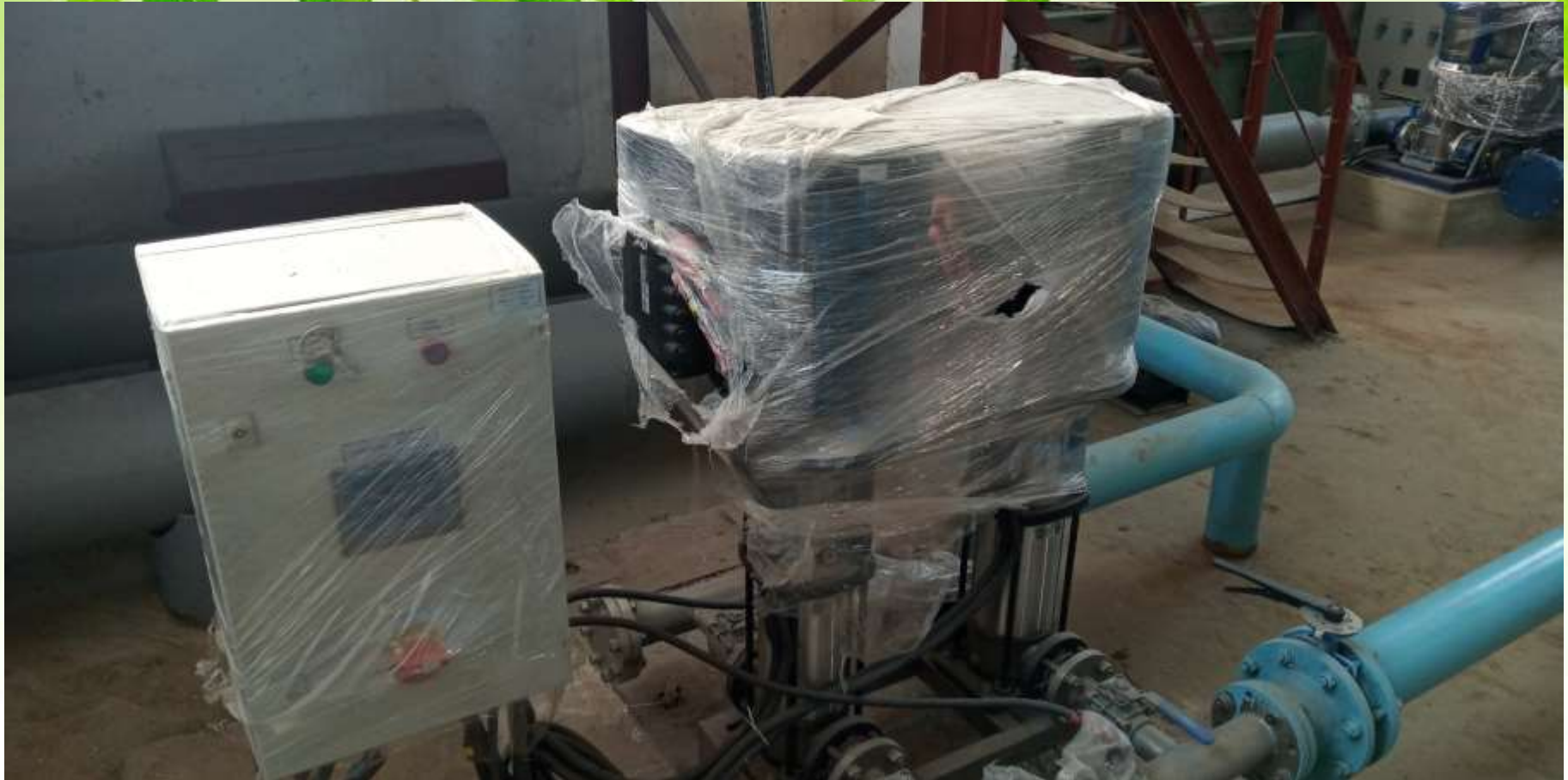
Насосне обладнання з автоматичною системою регулювання. (Проект водогону від II підйому до с. Вищетарасівка)