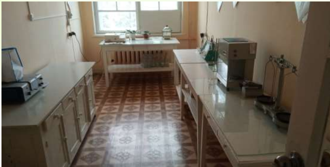
Хіміко-бактеріологічна лабораторія мережі водопроводу.