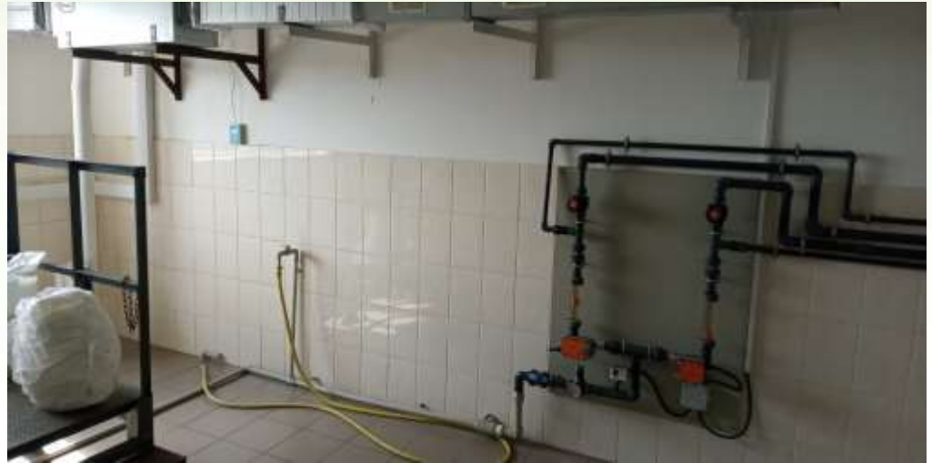
Станція приготування та дозування флокулянта.