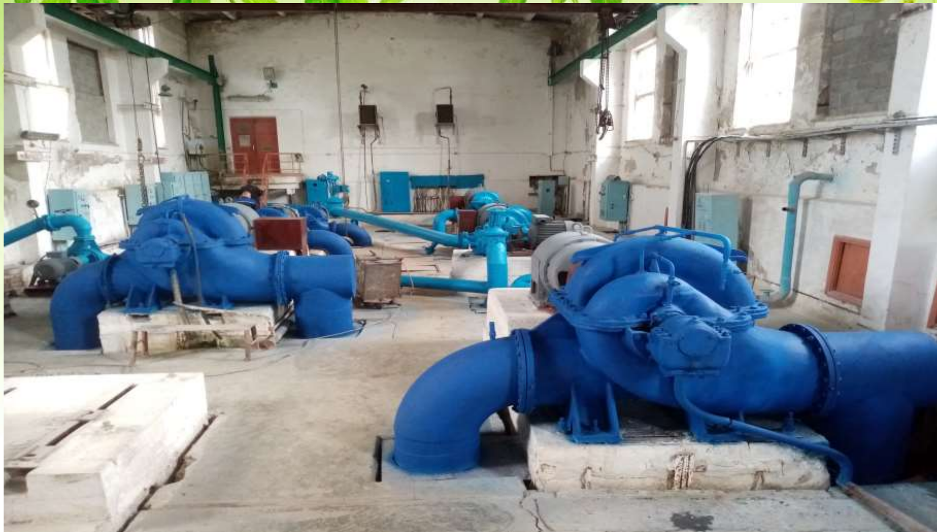
Машзал II-го підйому.