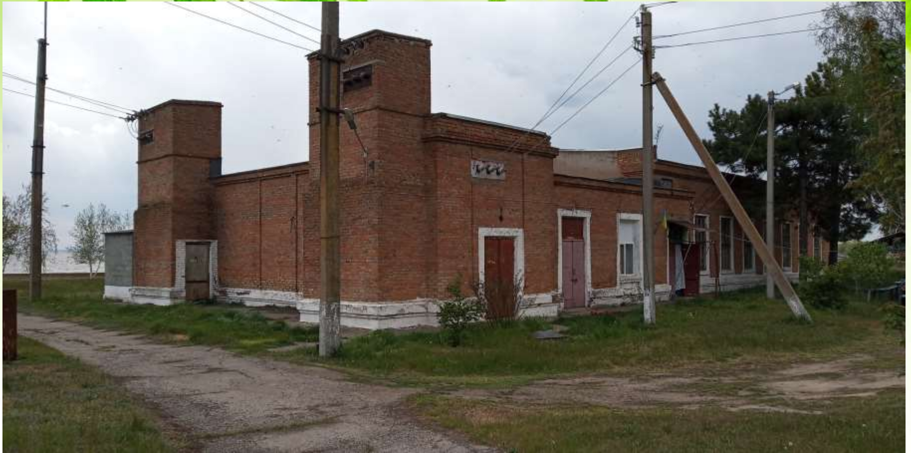
Насосна станція I підйому.