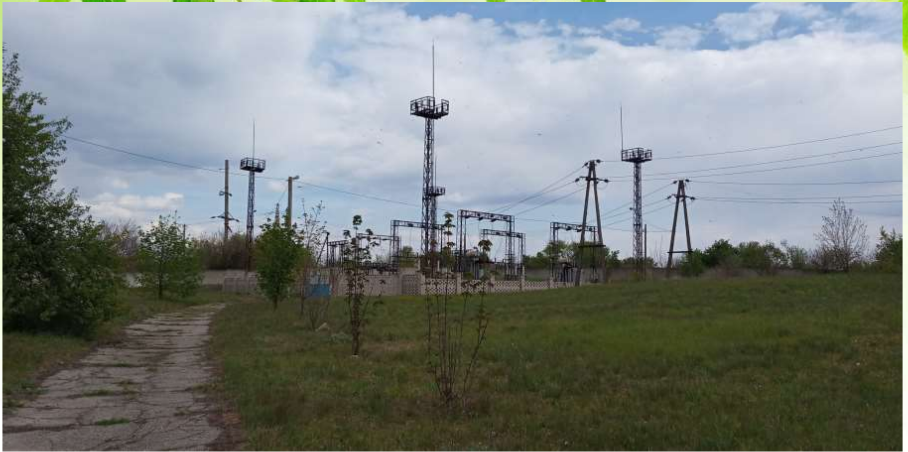
Високовольтна підстанція 35/6 кВ I-го підйому