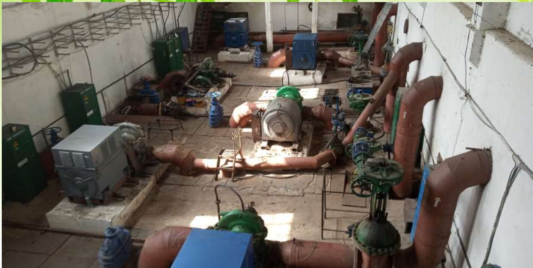
Машзал НС I підйому.