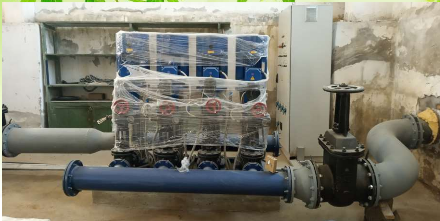
Насосне обладнання з автоматичною системою регулювання. (Проект водогону від II підйому до с. Вищетарасівка).