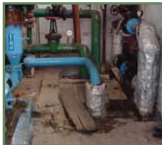
Стан ТРП до реконструкції