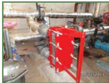
Стан ТРП після реконструкції