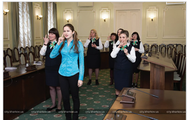
Рис. 8. Навчання працівників спілкуванню мовою жестів

Місто Харків перейняло досвід інших міст світу, де водії з вадами слуху мають із собою картки, які допомагають їм спілкуватися з поліцейськими. На пластиковій картці водія