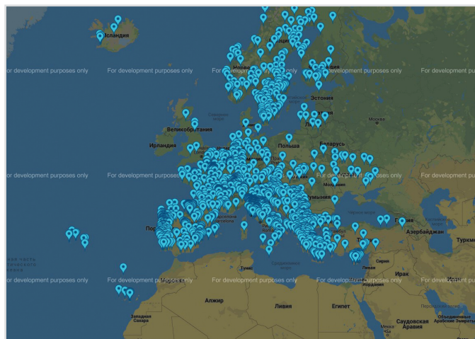
Рис. 2. Атлас Сторін, що підписали Хартію 11

Атлас Сторін , які підписали Хартію, є інструментом для визначення підписантів, їхніх планів дій і найкращого досвіду. Наявність на Атласі дає змогу підвищити видимість вашого місцевого органу влади на європейському рівні, розповсюдити й просувати свій досвід та напрацювання щодо досягнення рівності між жінками й чоловіками. Ви також можете скористатися передовою практикою, яку здобули ваші європейські сусіди. Метою цього інструменту є сприяння обміну між підписантами та заохочення розвитку децентралізованої співпраці.