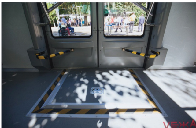
Рис. 4. Громадські місця. Підйомники для людей з інвалідністю

Рис. 3. Громадський транспорт. Доступність транспорту для маломобільних груп населення (люди з інвалідністю; громадяни на візках; батьки з дитячими візочками та ін.)