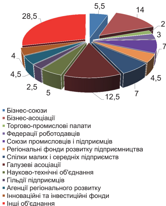
Рис. 2. Структура бізнес-об'єднань міст-партнерів Проекту ПРОМІС

До групи «Інші об'єднання» було включено молодіжні, жіночі організації, інші бізнес-об'єднання, які мають не прямий, а дотичний стосунок до розвитку підприємництва та створення належних умов для розбудови МСП. Регіональний розподіл бізнес-об'єднань у розрізі міст-партнерів Проекту ПРОМІС представлено в табл. 5.