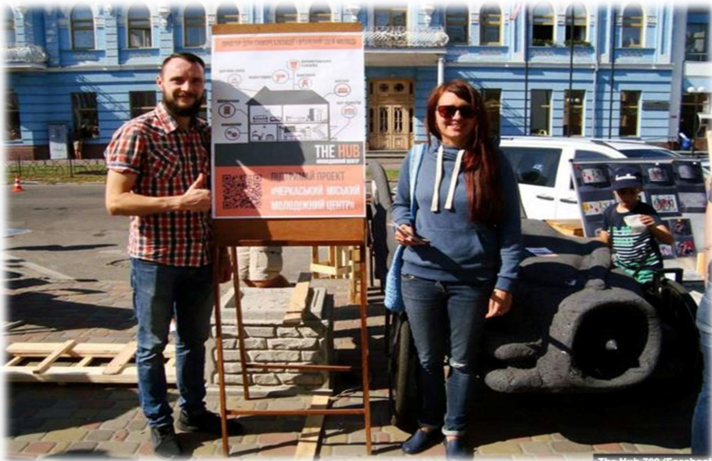
The Hub 700 (Facebook)

Асоціація міст України СПІЛЬНИМИ ЗУСИЛЛЯМИ