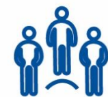
СЕКРЕТАРІ МІСЦЕВИХ РАД