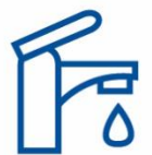
ЖИТЛОВО КОМУНАЛЬНЕ ГОСПОДАРСТВО